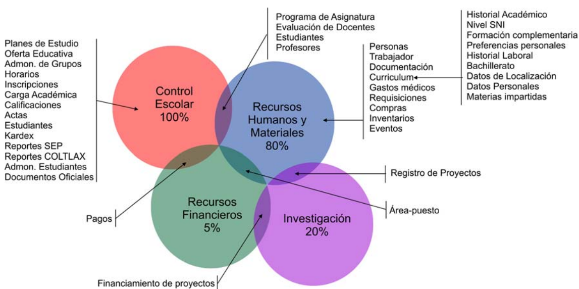
Figura 2. Sistema de Información Integral de El Colegio de Tlaxcala

Para actualizar el acervo de la biblioteca, entre donaciones, depósitos y adquisiciones, se incrementa con 898 títulos para hacer un total de 8,073 títulos y 14,009 ejemplares; como producto de convenios el Coltlax adquirió cuatro computadoras Laptop que son entregadas a los profesores investigadores para su trabajo.